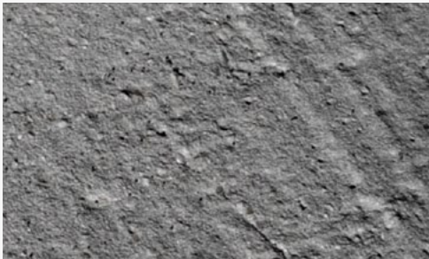
Fräs-/Strahlbild ungeeignet: Reste von Zementschalen