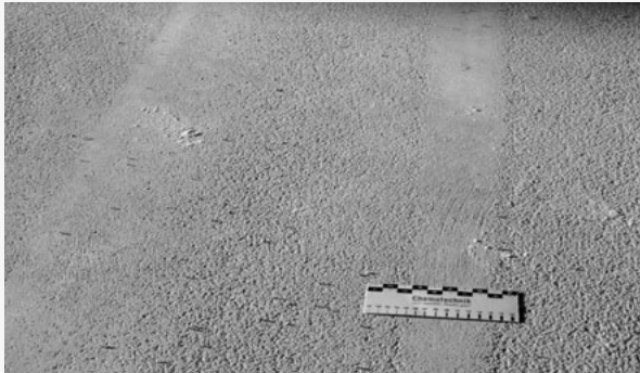
Fräs-/Strahlbild ungeeignet: Reste von Feinmörtel, kein Korngefüge

Maßnahmen: Stemmen, Stocken, Fräsen, Strahlen