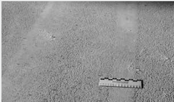
Fräs-/Strahlbild ungeeignet: Reste von Feinmörtel, kein Korngefüge

Maßnahmen: Stemmen, Stocken, Fräsen, Strahlen