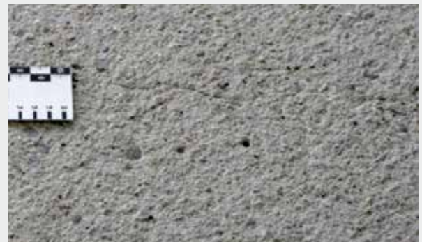
Fräs-/Strahlbild ungeeignet: Reste von Feinmörtel, kein Korngefüge