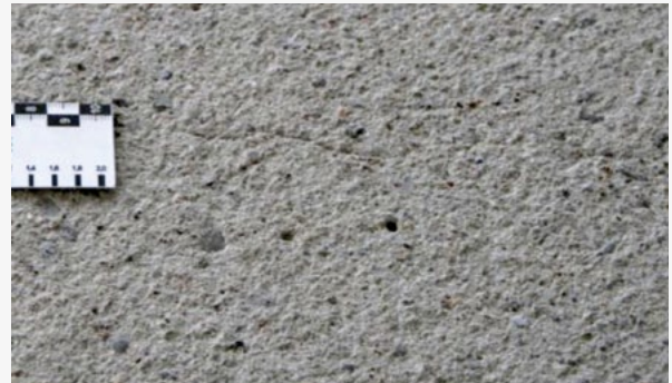
Fräs-/Strahlbild ungeeignet: Reste von Feinmörtel, kein Korngefüge