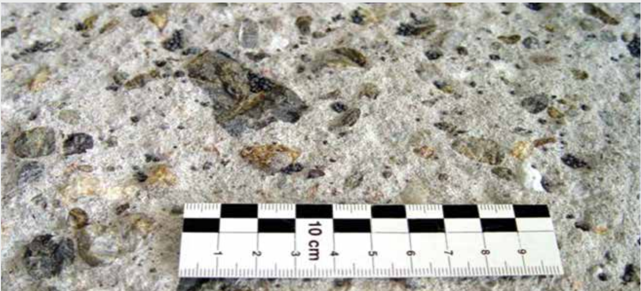
Fräs-/Strahlbild optimal: freigelegtes Korngefüge mit sichtbarem Kornbruch, Oberfläche rau und griffig

Bei der Sanierung im Bestand wird vor Durchführung von Maßnahmen zur Untergrundvorbereitung stets die Entnahme von Bohrproben empfohlen, um die grundsätzliche Beschaffenheit (Art, Schichtenaufbau, Qualität, Lage der Bewehrung etc.) der vorhandenen Tragkonstruktion festzustellen. Der Abtrag von Beton sollte schichtweise (max. 10 mm/Fräsgang) erfolgen, um Gefügeschäden durch die Meißelkräfte zu begrenzen. Nach dem Fräsen ist stets ein nochmaliges Kugelstrahlen notwendig. Im Zweifelsfall Fachberatung anfordern und/oder Testflächen anlegen.