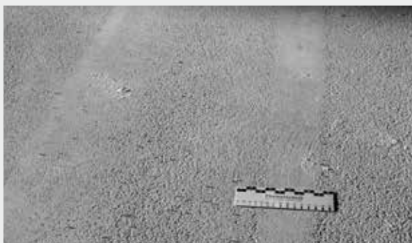
Fräs-/Strahlbild ungeeignet: Reste von Feinmörtel, kein Korngefüge

Maßnahmen: Stemmen, Stocken, Fräsen, Strahlen