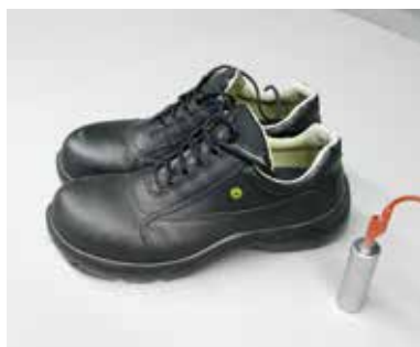
Ableitfähiges Schuhwerk (ESD)