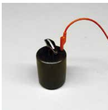
Elektrode, 2,5 kg