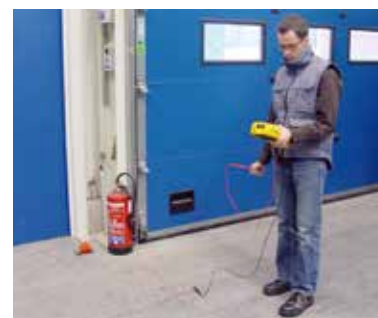
Messanordnung für R_{PA}