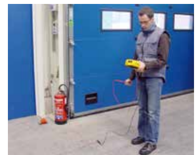
Messanordnung für R_{PA}